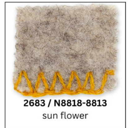
2683 / N8818-8813 sun flower