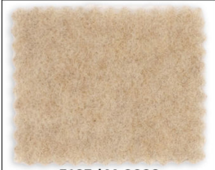
5197 / M-8020 angora