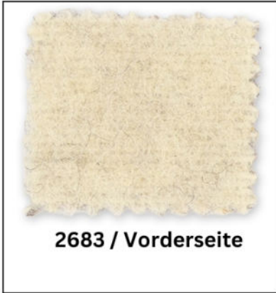
2683 / Vorderseite