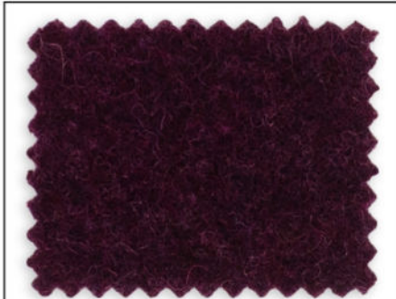
2650 / M846 kaktusblüte