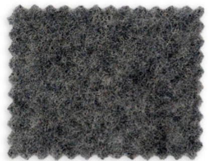
5197 / M-116 dolomiten