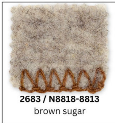
2683 / N8818-8813 brown sugar