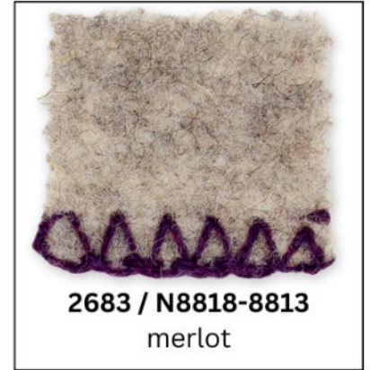
2683 / N8818-8813 merlot