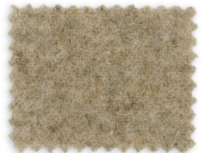
2650 / M213 stroh