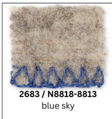
2683 / N8818-8813 blue sky