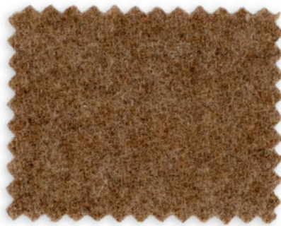
5197 / F-313 caramel