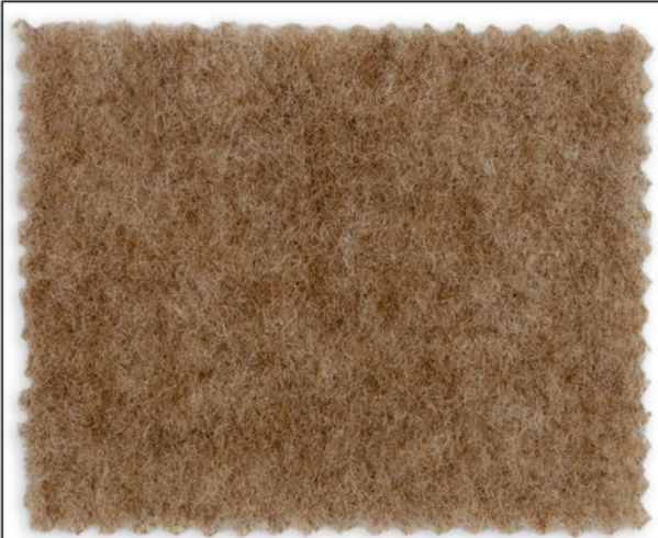
5719 / N-7121 graubraun