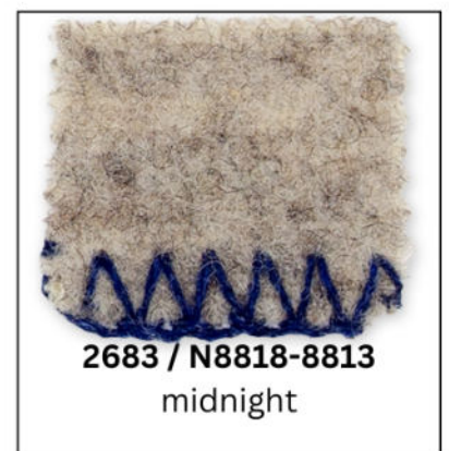
2683 / N8818-8813 midnight

individuelle Farben der Umkettelung nach Absprache möglich