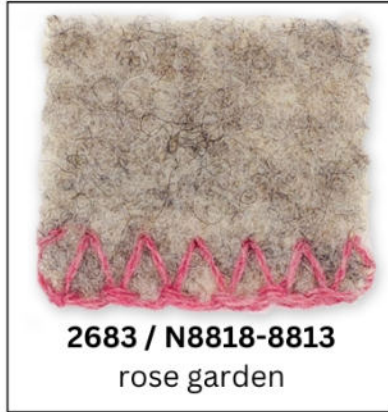
2683 / N8818-8813 rose garden