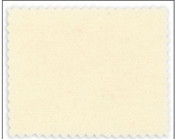
5719 / F-8889 naturweiß